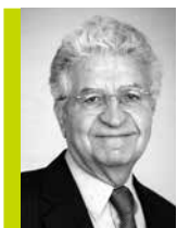
Edmond Alphandéry (1)

Né le 7 mars 1956 à Tunis (Tunisie), de nationalité française 59 ans