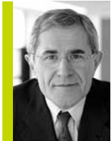
Gérard Mestrallet (1)